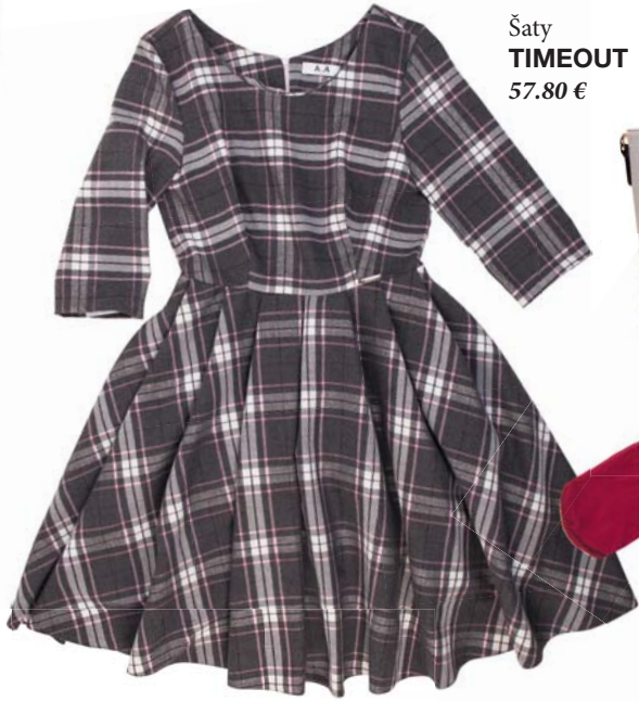
Šaty TIMEOUT 57.80 €