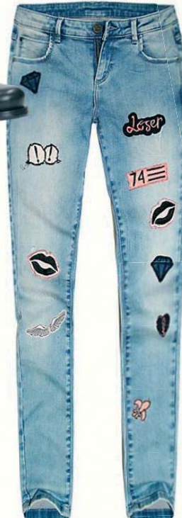
Džínsy House 29.99 €