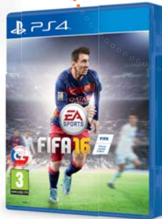
Hra FIFA 16 Brloh od 49.99 €

Nechce sa vám namáhať? Tak si môžete vyskúšať nenáročnú verziu futbalu. Navyše si môžete prvykrát v histórii zahrať za ženský nadnárodný tím.