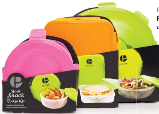
Boxy na jedlo Panta Rhei od 11.90 €