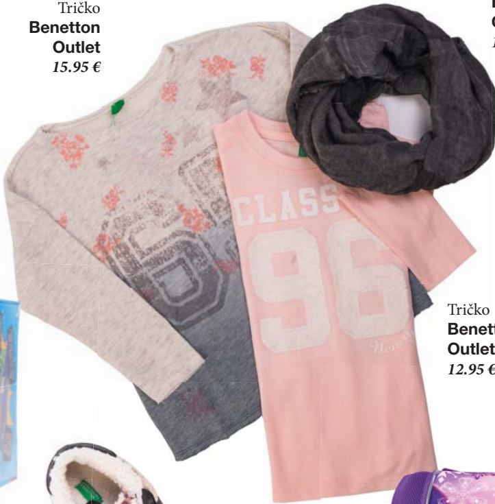
Tričko Benetton Outlet 12.95 €