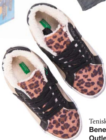
Tenisky Benetton Outlet 26.95 €