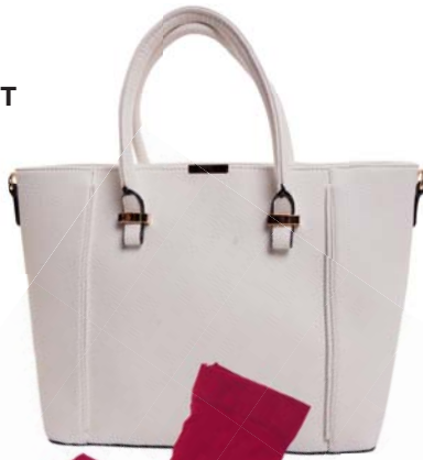
Kabelka CCC 29.95 €