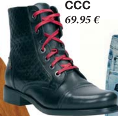
Topánky CCC 69.95 €