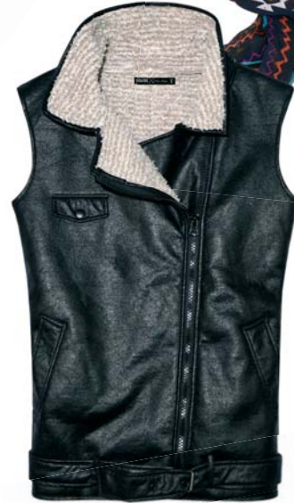
Kožená vesta House 25.99 €