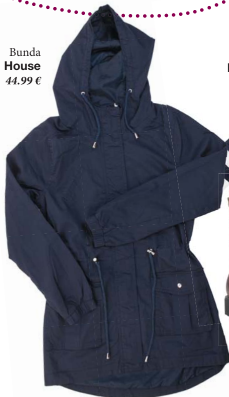
Bunda House 44,99 €

Šaty Moda Bella 63 € Kabát Moda Bella 123 € Kabelka John Garfield 49,99 € Topánky John Garfield 49,99 € Dáždnik Pinky Club 5,90 €