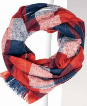
Šál House info o cene v predajni