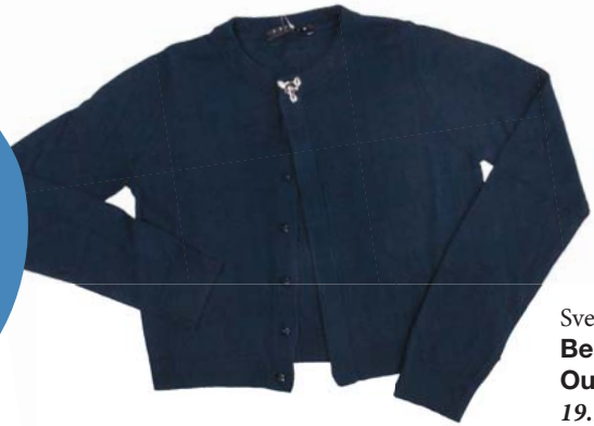
Sveter Benetton Outlet 19.95 €

Spríjmite deťom začiatok školského roka novými učebnými pomôckami či oblečením.