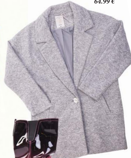
Kabát House 64.99 €