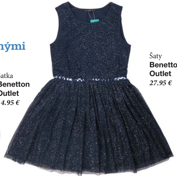
Šaty Benetton Outlet 27.95 €