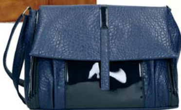
Kabelka CCC 29.95 €