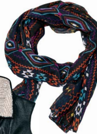
Šatka House 9.99 €