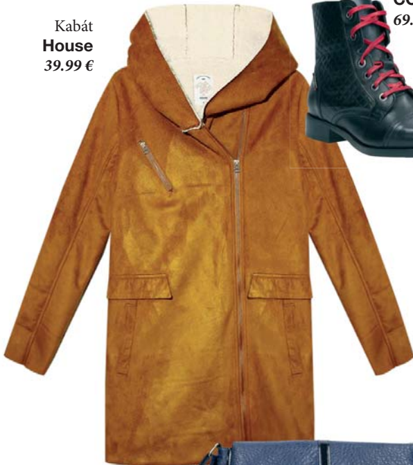
Kabát House 39.99 €