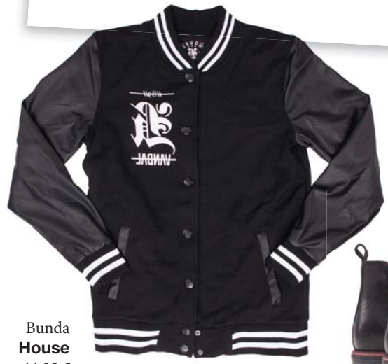
Bunda House 44.99 €