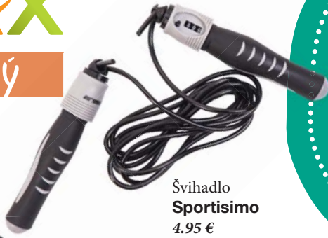
Švihadlo Sportisimo 4.95 €