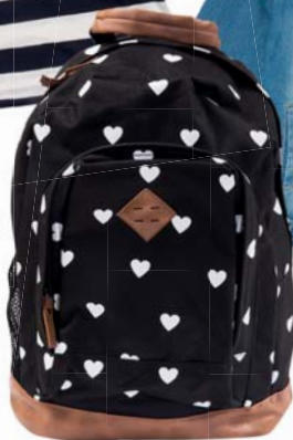
Ruksak Hose 29,99 €