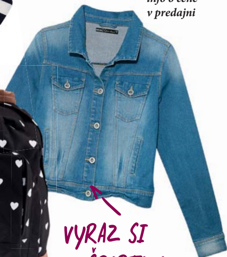
Bunda House info o cene v predajni