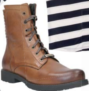
Topánky CCC 69,95 €