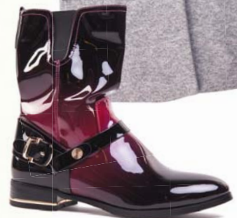
Gumáky John Garfield 47.99 €