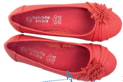
Balerínky CCC 13.95 €