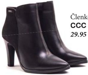
Členkové čizmy CCC 29.95 €