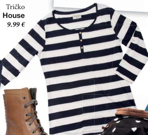
Tričko House 9,99 €