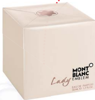
Parfum MontBlanc Lady Emblem EdP 50 ml FAnn parfumerie 65 €

Ak ste maniačka na parfumy, potom vašej pozornosti nesmie ujsť novinka od značky Lanvin. Eclat de Fleurs je nežná vôňa, ktorá vyzdvihuje prirodzenú zmyselnosť ženy. Pripravte sa na svieže ovocné vône. Alebo vyskúšajte Mont Blanc a Lady Emblem, ktorého dominantou je ružové saké.