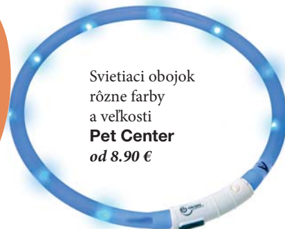
Svietiaci obojok rôzne farby a veľkosti Pet Center od 8.90 €