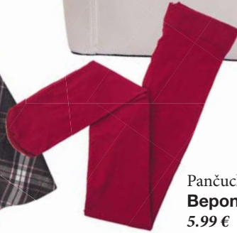
Pančuchy Bepon 5.99 €