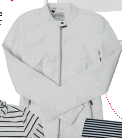
Bunda Kenvelo 64.99 €