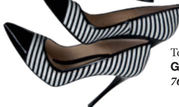
Topánky Gallery shoes 76 €

Horizontálne prúžky sú klasikou, ktorú si môžete obliecť pokojne do práce alebo na príležitosti, kedy potrebujete byť elegantná.