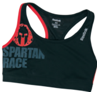
Športová podprsenka EXIsport 24.99 €

Pitný režim nie je potrebné dodržiavať počas samotného behu, teda ak sa nehýbete viac ako hodinu. Tekutiny si doplňte až po športovom výkone.