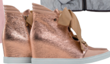
Tenisky Rela 159.95 €