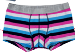
Trenírky SKINY 19.99 €