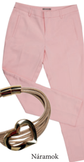
Náramok By Dziubeka 15.30 €

Po vertikálnom vzore siahajú ženy, ktoré chcú danú časť tela predĺžiť alebo zoštíhliť. Zvislé pružky sa teda hodia nízkym dáмам, ale aj tým, ktoré nemajú postavu modelky. O to viac pomôžu zamaskovať kritické partie, čím bude ich farebný kontrast väčší. V praxi to znamená, že predĺženiu postavy pomôže viac čierno-biely pásik, než napríklad zeleno-modrý. Tieto dva odtiene totiž nevytvárajú až taký kontrast.