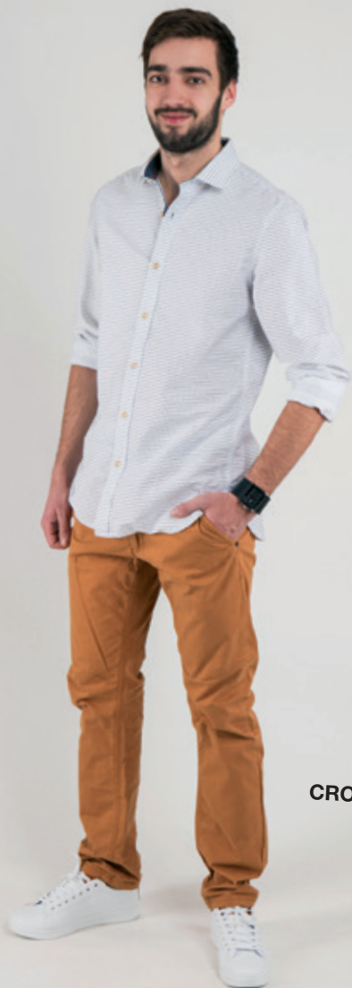
Košela Valentín 35.99 € Nohavice CROPP TOWN 24.99 € Tenisky CCC 25.95 € Hodinky Macado 147.40 €

Základným pravidlom je, že jeden pruhovaný kúsok v outfitu bohato stačí. Pokiaľ sa však bavíme o pásikavej košeli, tú sa nebojte kombinovať so vzorovanou kravatou. Iba v tomto prípade to môžu byť ďalšie pružky, ale v inej šírke. Každý pásikavý kúsok oblečenia by mal na vašej postave sedieť.