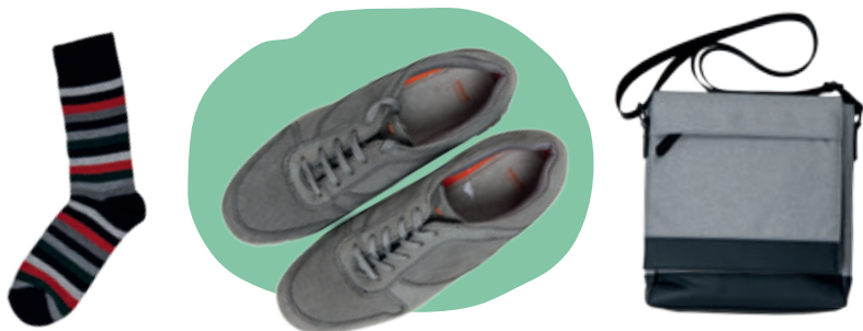
Ponožky Baťa 4.99 € • Topánky Baťa 59.99 € • Taška Reserved info o cene v predajni

Môžete mať akékoľvek krásne oblečenie, ale ak si nedáte pozor na doplnky, môže sa celý efekt pokaziť. Platí to, samozrejme, aj opačne. Nudný outfit dokážu oživiť a zachrániť topánky, tašky, ale aj ponožky. Naučte sa tieto doplnky nosiť.