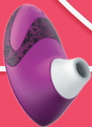
Womanizer Masážny strojček Erotic City 274.99 €

spríjemnite si ju erotickými pomôckami, ktoré už dnes vyzerajú tak rafinovane.