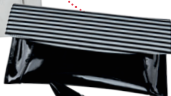
Kabelka Gallery shoes 43 €