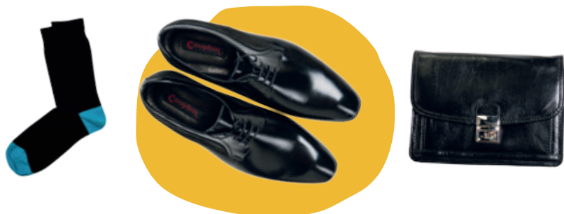
Ponožky Bepon 7.99 € • Lakovky Baťa 94.99 € • Aktovka Lara Bags 62 €

Voľte si druh a strih podľa príležitosti. Ak môžete byť športovo a ležérne obutí, jasnou voľbou sú tenisky. Na slávnostnej príležitosti nič nepokazíte lakovanými čiernymi topánkami, ktoré by nemali chýbať žiadnemu chlapovi. Čím menej lesku, tým menej formálna príležitosť. Preto, ak máte byť síce elegantní, ale nejde až tak o dress code, môžete voľiť topánky z nelakovanej či brúsenej kože. Populárnymi v pánskej móde sú momentálne oxfordky s perforovanou špičkou a členkové topánky bez zapínania, s gumou.