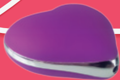
Masážne srdiečko Pulsatio Heart Erotic City 54.95 €