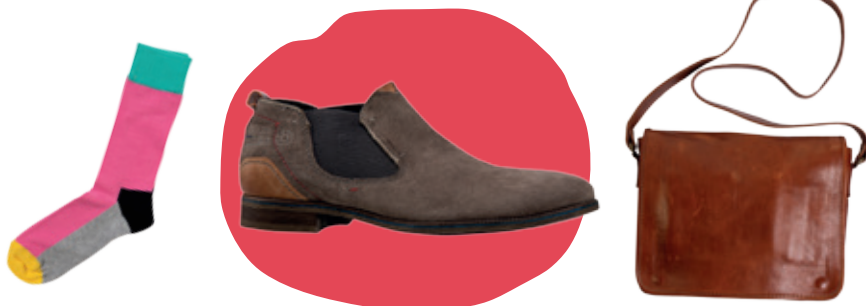
Ponožky Bepon 7.99 € • Topánky Gallery Shoes 83 € • Taška Lara Bags 138 €

Veselá farba alebo nápaditý vzor dokážu spríjemniť aj inak šedivý deň.