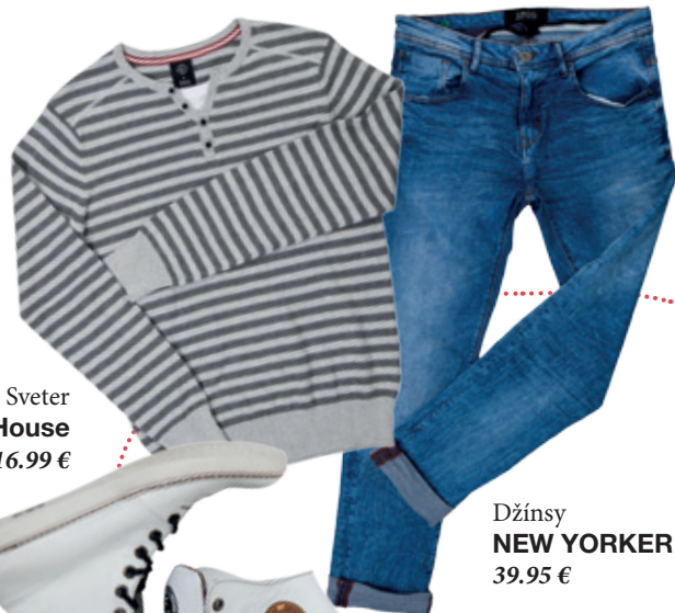
Sveter House 16.99 €