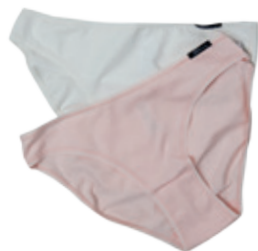
Funkčné nohavičky SKINY 19.99 € / 2 ks

Funkčná bielizeň je tiež pri pohybe nevyhnutnosťou. Saje pot a ak je to potrebné, zahreje vás.