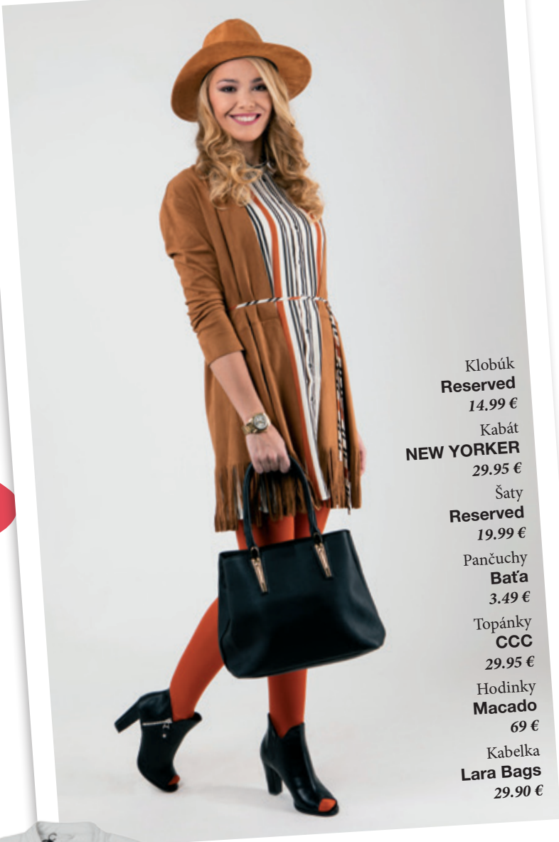
Klobúk Reserved 14.99 €

Horizontálne prúžky sú klasikou, ktorú si môžete obliecť pokojne do práce alebo na príležitosti, kedy potrebujete byť elegantná.