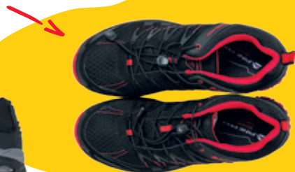
Dámske tenisky Alpine Pro 74.99 €

Funkčná bielizeň je tiež pri pohybe nevyhnutnosťou. Saje pot a ak je to potrebné, zahreje vás.