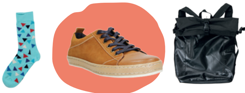
Ponožky Bepon 7.99 € • Topánky CCC 24.99 € • Ruksak Reserved 34.99 €

Môžete mať akékoľvek krásne oblečenie, ale ak si nedáte pozor na doplnky, môže sa celý efekt pokaziť. Platí to, samozrejme, aj opačne. Nudný outfit dokážu oživiť a zachrániť topánky, tašky, ale aj ponožky. Naučte sa tieto doplnky nosiť.