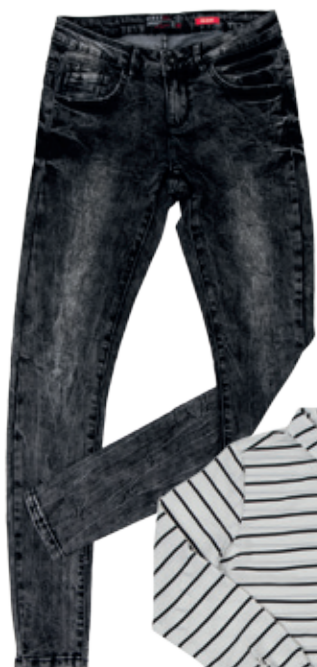
Blúzka House 14.99 €

O tom, ako v pásikoch budete vyzerat', rozhoduje viacero faktorov. Ani vodorovné vás nemusia rozširovať, ak siahnete po správnej šírke vo vzore. Čím širšie a výraznejšie pásiky sú, tým viac opticky pridávajú kilá.