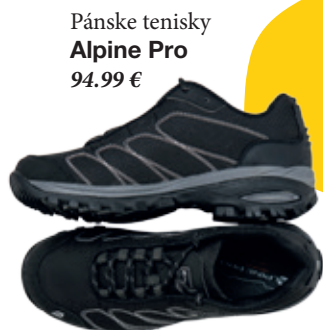
Pánske tenisky Alpine Pro 94.99 €

Pri behu je veľmi dôležitá obuv, ktorú začiatočníci podceňujú. Nestačia tenisky, je potrebné mať ich vyrobené na taký povrch, po akom sa chystáte behať. Odporúča sa brať si o pol čísla, až číslo väčšiu veľkosť.