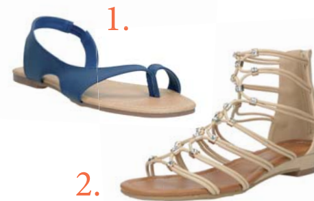
1. Sandále, CCC 11.95 € 2. Sandále, CCC 19.95 €