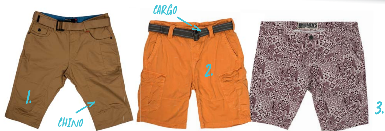
1. Šortky, EXIsport 34.99 € • 2. Šortky, EXIsport 34.99 € • 3. Šortky, Gate 19.98 €

Pri šortkách sa môžete stretnúť s dvomi základnými označeniami strihu. Chino šortky sú klasické jednofarebné kraťasy, ktoré vychádzajú zo strihu elegantných pánskych nohavíc, akurát majú skrátenu dĺžku. Ide o casual kúsok, ktorý si môžete v horúčavách pokojne obliecť do práce. S označením cargo sa zas stretávame pri šortkách, ktoré ľudovo nazývame kapsáče. Samozrejme, ide o strih a štýl vhodný skôr na voľný čas.