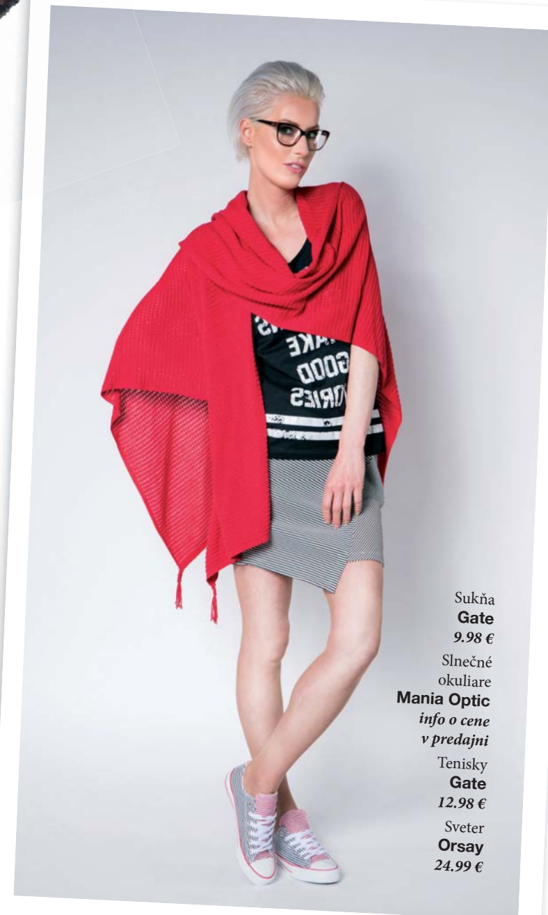
Sukňa Gate 9.98 € Slnečné okuliare Mania Optic info o cene v predajni Tenisky Gate 12.98 € Sveter Orsay 24.99 €

Grunge štýl, typický pre tieto roky, preferoval všetko, čo pôsobilo obnosene a vyblednuto, no bolo to pohodlné. Aj keď ženy nosili sukne, celkovo ich outfit pôsobil unisexovo, teda žiadne podpätky a minimum farieb.