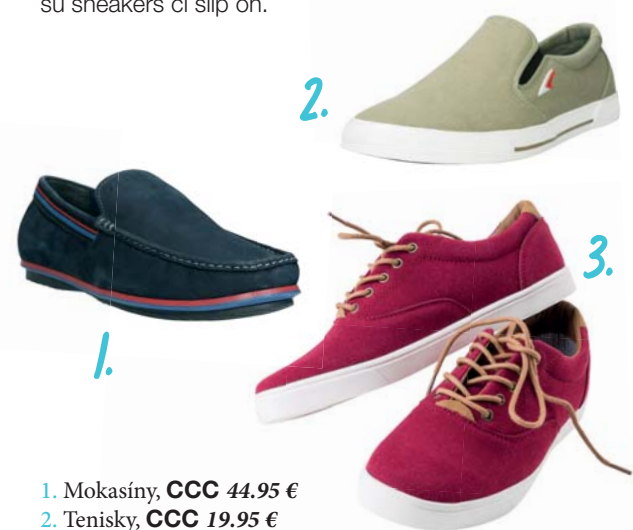
1. Mokasíny, CCC 44.95 € 2. Tenisky, CCC 19.95 € 3. Tenisky, Gate 25.98 €

Záleží od toho, aké ďalšie kúsky oblečenia chcete ku šortkám kombinovať. V prípade, že pôjdete do elegancie s košeľou, voľte pokojne mokasíny. Voľnočasový štýl a najčastejšia letná klasika je kombináciou so žabkami. Ak siahnete po teniskách, nebojte sa zas moderných typov ako sú sneakers či slip on.