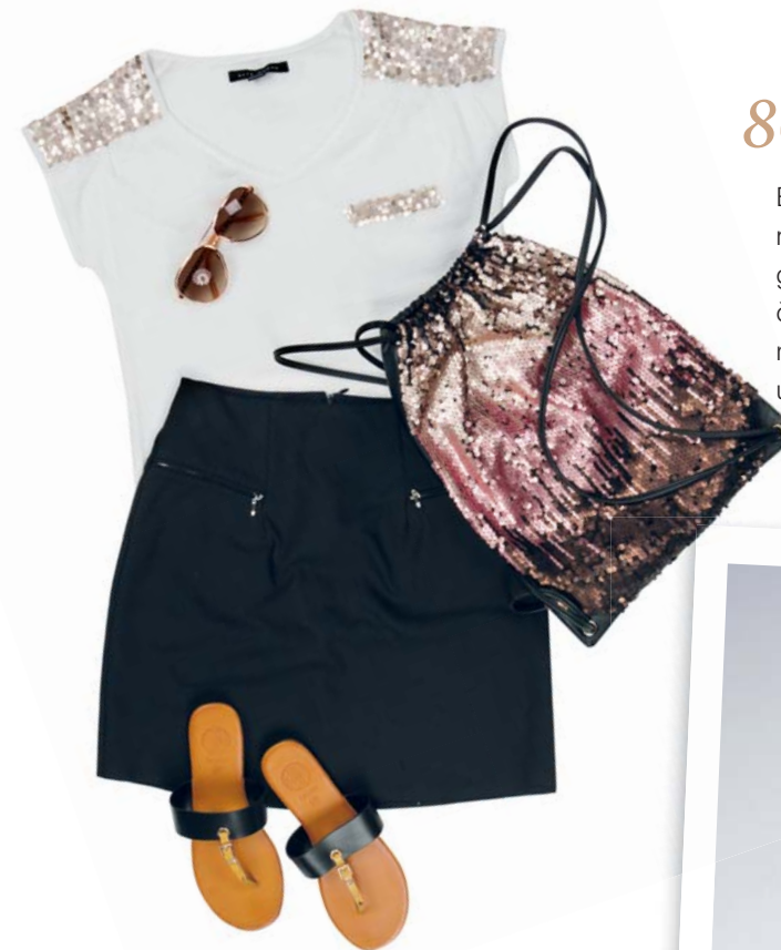
Sukňa, Orsay 18.99 € • Žabky, CCC 11.95 € Ruksak, Reserved 19.99 € Tričko, Gate 12.98 € Slnečné okuliare, Gate 4.98 €

Éra disko sa prejavila aj v móde, a tak sa nosilo všetko, čo sa ligotalo, až to bolo mierne gýčové. Sukne museli byť obtiahnuté, vrchná časť oblečenia zas voľná. Celkový dojem však mal pôsobiť eroticky, takže podprsenka sa už nenosila len pod oblečením.