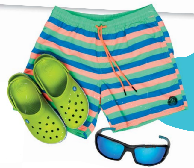
Plavky, EXIsport 39.99 € Crocsy, EXIsport 41.99 € Slniečne okuliare, EXIsport 37.99 €