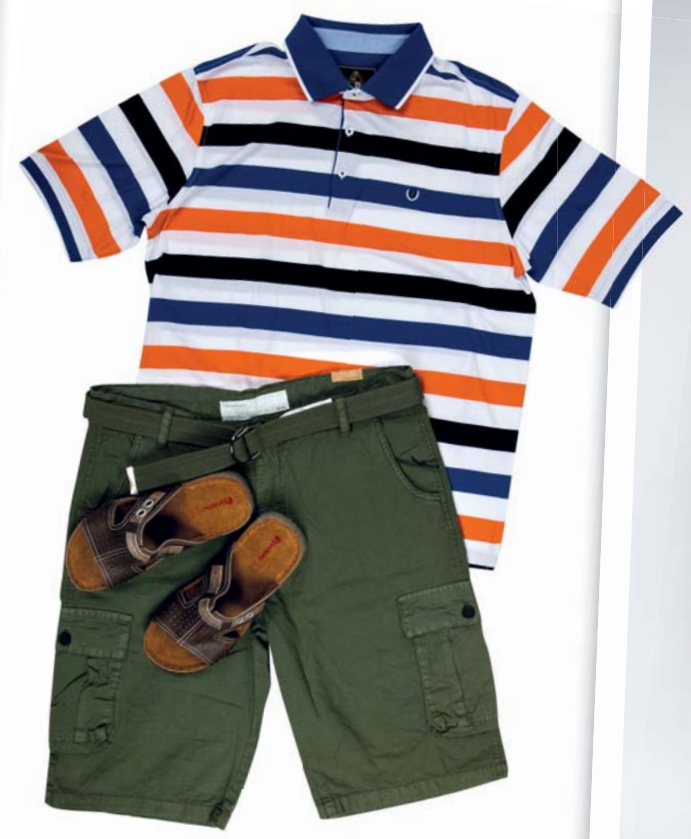
Šortky, Gate 25.98 € Šľapky, CCC 19.95 € Tričko, Ozeta 29 €