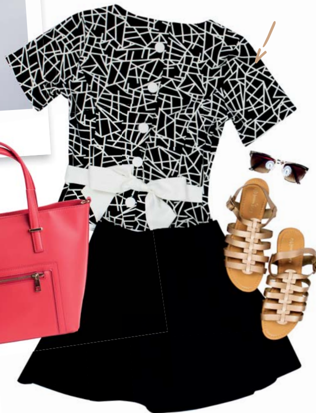
Top, Lantch & Shoes 44.90 € • Sukňa, Lantch & Shoes 34.90 € Sandále, CCC 15.95 € • Slnečné okuliare, Gate 4.98 € • Kabelka, Lara Bags 102 €

V tomto desaťročí sa nosilo všetko krátke. A sukne ešte kratšie! Charakteristické boli geometrické tvary a farby. Ikonou tejto doby bola Twiggy, ktorá vďaka svojej vysokej a štíhlej postave ani k mini nepotrebovala podpätky.