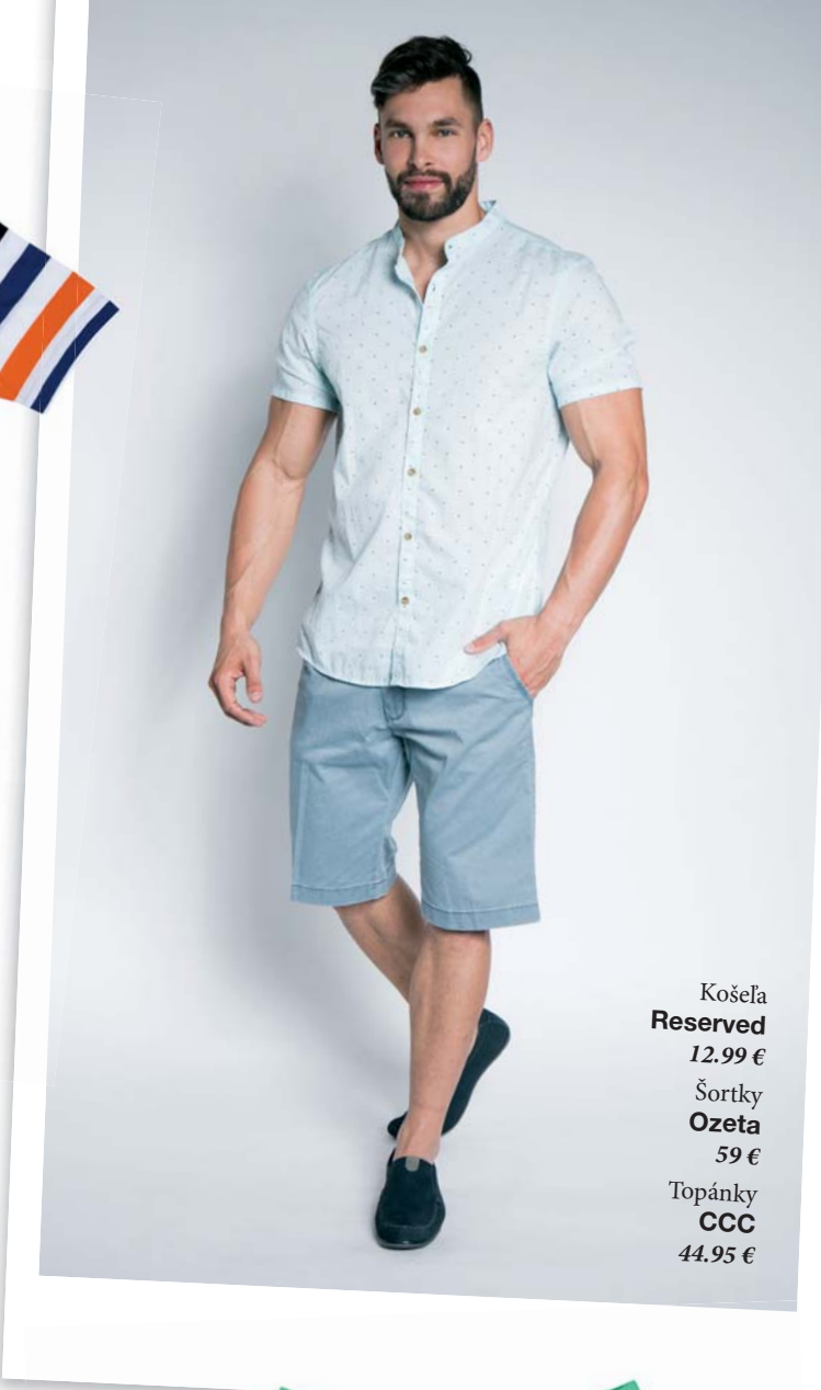
Košela Reserved 12.99 € Šortky Ozeta 59 € Topánky CCC 44.95 €